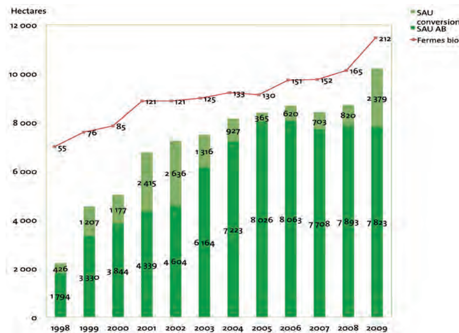
Evolution des surfaces et du nombre de fermes en AB et en conversion