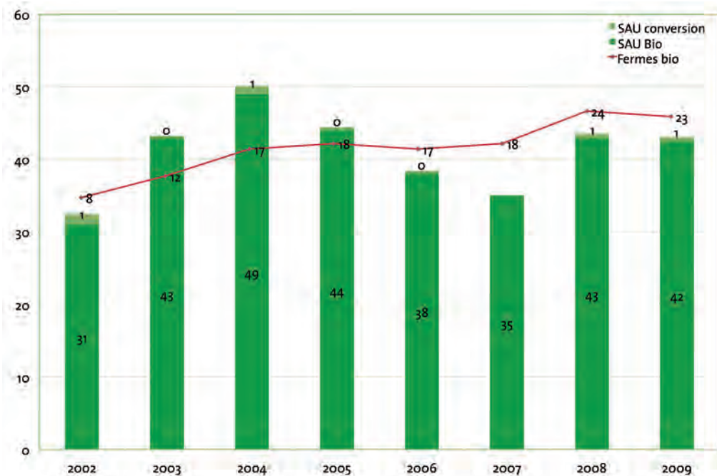
Evolution pluriannuelle du nombre de fermes pratiquant la culture de PAM et surfaces associées

L'effectif et les surfaces des fermes pratiquant la culture des plantes aromatiques et médicinales bio (PAM) se stabilisent depuis l'an dernier. En 2009, deux producteurs ont cessé cette activité de diversification en raison de difficultés à vendre sur le marché des plantes en vrac et des huiles essentielles. Un nouveau producteur céréalier s'est diversifié et a intégré la coopérative Plantes de Pays en 2010. Un producteur a fait certifier son activité en bio mais respectait déjà un cahier des charges proche de celui de l'agriculture bio (syndicat « SIMPLES »). Les prix de marché sont en baisse pour quelques plantes bio en vrac et sont revenus au niveau de 2007, mais dans l'ensemble les prix sont stables. La vente directe peut s'avérer rentable si elle s'accompagne d'une valorisation par la transformation et une bonne connaissance des lieux de vente proches. La vente directe est souvent pratiquée en complément de la vente en vrac ou d'une autre activité sur la ferme.